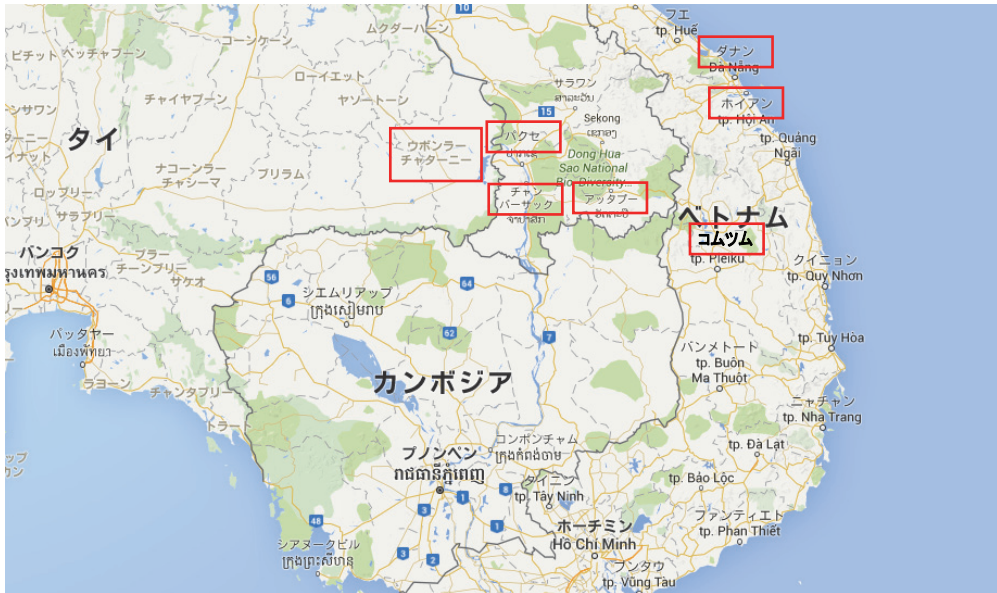
地図 1 2016 年度夏季実態調査訪問地

一息ついて、タイ料理の夕食となった。恒例では結団式を兼ねた夕食となるところだが、同レストランでは歓迎の生バンドの演奏が続いたことで、結団式は翌日以降に持ち越されることとなった。これからタイ、ラオス、ベトナムと、国際道路を西から東に向かって二つの国境を越えるバスの旅となる。タイの香辛料の利いた (人によっては辛〜い) 料理が、東に向かうにつれて次第にまろやかな味に変容していくことも合わせて体得できることだろう。今宵は激辛の品々を堪能した。