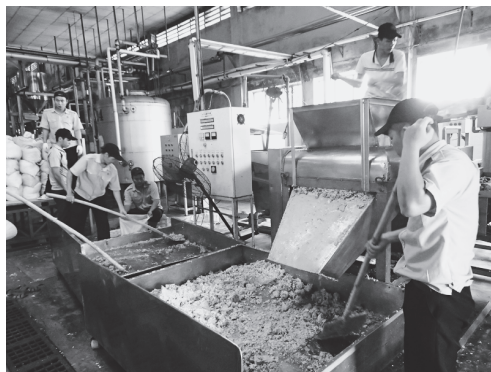
【写真 31】福岡が本社の HFC（フエ・フード・カンパニー）訪問