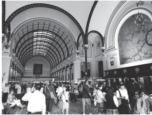
【写真3】中央郵便局内はほぼ土産屋