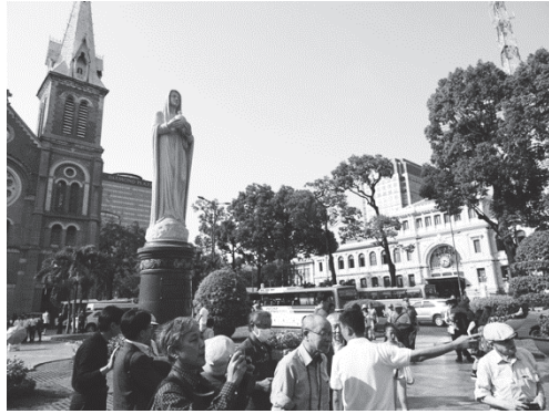
【写真2】サイゴン大教会（左）と中央郵便局（右）