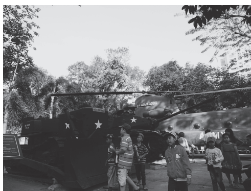
【写真 27】軍機が出迎える戦争博物館入り口（左）と戦車（右）