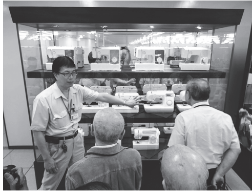
【写真8】ブラザーで主力製品のミシンについてレクチャーを受ける