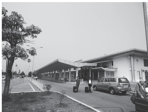
【写真 28】ホーチミン市からフエ市へ移動（飛行機）