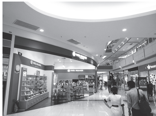
【写真 25】ホーチミン市郊外・イオンモール（Aeonmall Vietnam Co., LTD）2号店