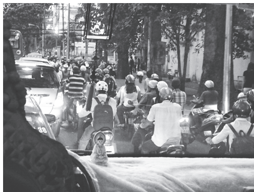
【写真4】夕食に向かうバスは夕方のラッシュに遭遇（オートバイの流れ）