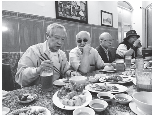
【写真 24】三日目の夕食は、屋台風ローカル食にて