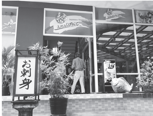
【写真9】昼食は工業団地内・日本食レストラン「あまてらす」にて