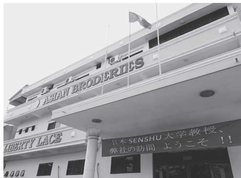
【写真 20】レース製造工場 Liberty Lace では「日本 SENSHU 大学教授、弊社の訪問 ようこそ!!」と熱烈歓迎