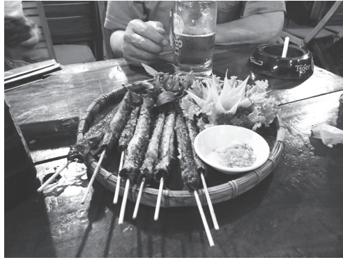
【写真 14】洗練されたベトナム料理