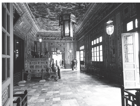
【写真 30】カイティン帝廟見学 贅を尽くした内装