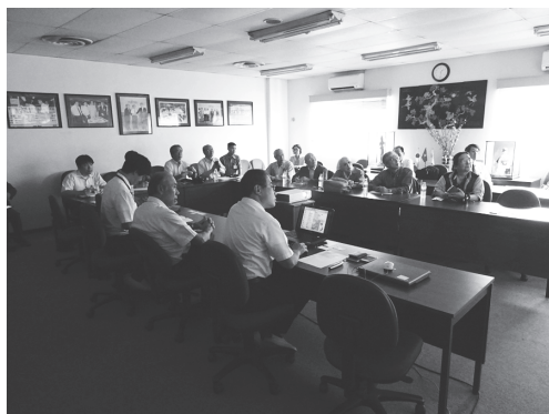
【写真 11】工場ラインの見学の前にレクチャーを受ける

午後は富士通（Fujitsu Computer Products of Vietnam, INC）を訪問。