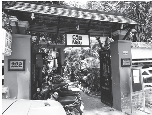
【写真 19】ベトナム料理、昼食・レストラン