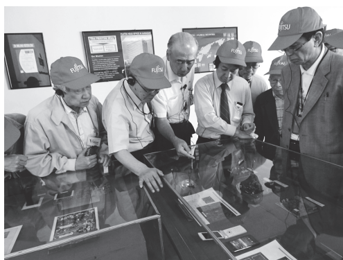
【写真 12】工場見学の最後は主力製品の最新基盤を