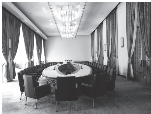
【写真 26】旧大統領官邸外観（左）と内部の会議室（右）