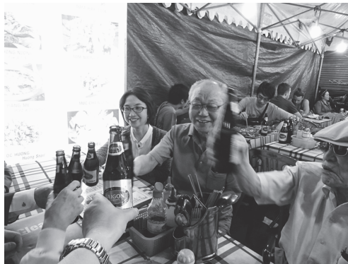
【写真6】夕食後自由時には街の屋台に繰り出し参与を囲んで社研の越し方をうかがう