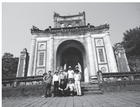
【写真 29】世界遺産・トゥドゥック帝廟のハス池（左）と皇帝の墓の前で記念撮影（右）