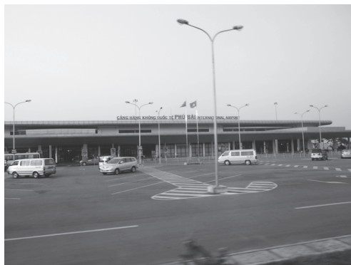
【写真 32】フエからハノイに移動（飛行機）