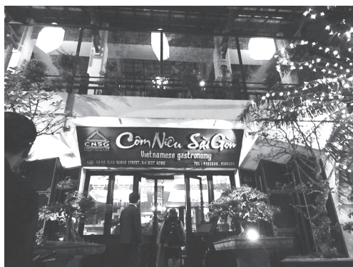
【写真 13】夕食は外国人観光客御用達のベトナム料理屋にて