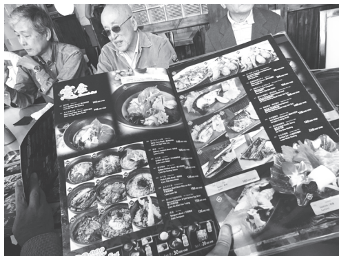
【写真10】「あまてらす」の日本食メニュー