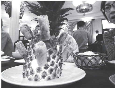
【写真5】初日夕食はウエルカムディナーでベトナム料理