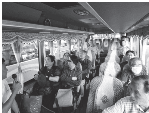
【写真1】移動の専用バス車中、以後、ホーチミンでの移動はこのバスで