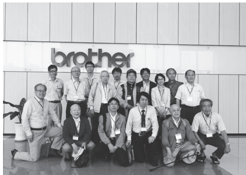
【写真7】ブラザー（Brother Industries Saigon, LTD）を訪問