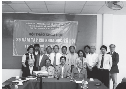
【写真 18】ベトナム社会学院南研究所にて