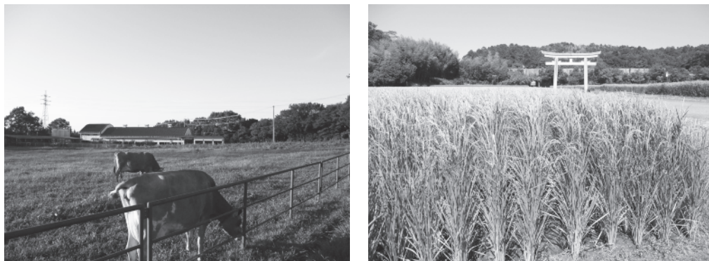
(写真左) 共進牧場 (写真右) ブランド酒米として有名な山田錦