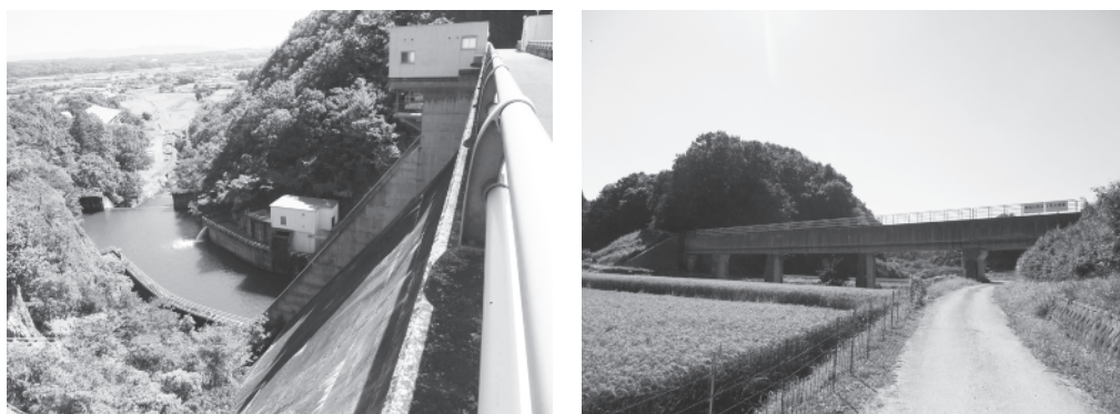
(写真左) 鴨川ダム (写真右) 1号幹線水路橋