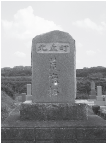
（写真）浄谷開拓地付近にある開墾碑

位置は前述小野開拓農協に近接しており、現在の浄谷町東新林周辺である。小野開拓農協と同様、増反者を中心として作られた組合であり、昭和25年1月17日に結成された。