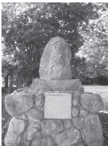
(写真左) 開拓神社 (写真右) 草加野開拓記念碑昭和35年建立