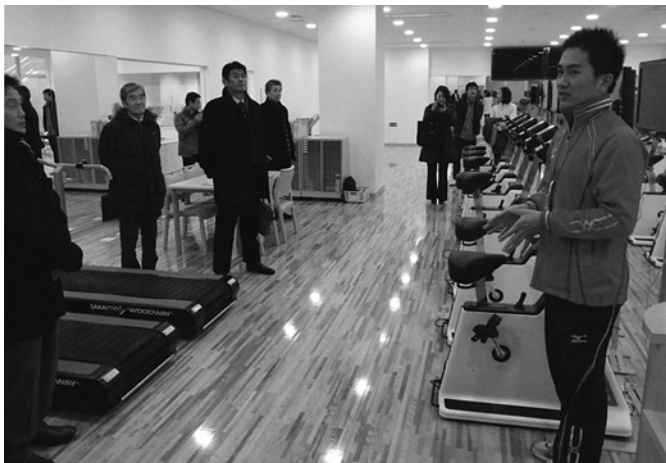
最新設備のメディカルフィットネスセンター

組織的強化を進める上で注目しなければならないのは、関係各所の方向性を見極めることが必要である。大学本部が考えるスポーツ強化の方向性、その中で立ち上がってきた「スポーツ強化機構」、スポーツ科学部としての構想、地域が大学に期待していること、などの情報を得ることが重要であり、さらにそれらを一元化してそれぞれの組織・機関とネットワークを築き、その中でサッカー部が将来的にどのような役割を果たしていくのかを考える必要がある。各組織や機関、地域が有機的に結びつく中でサッカー部の活動が展開されることによるメリットは極めて大きい。その連携は、サッカー部の強化環境の整備に繋がることはもちろん、その環境のなかで学生が活動することは、大学だけでは学ぶことができない社会的教育環境も得ることができると考えている。