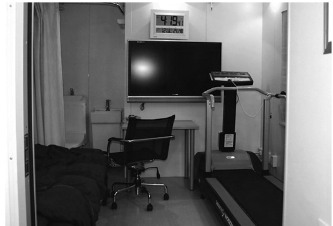
スポーツ科学部設置の「ヒューマンカロリーメーター」