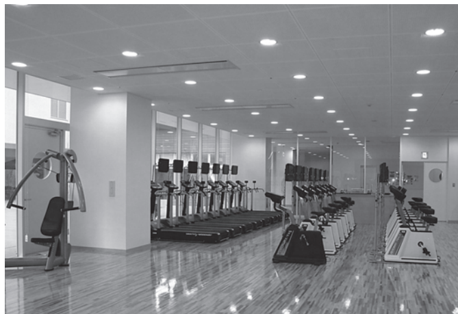
スポーツ科学部は昭和44年に創設された体育科学部を前身にしており、平成10年にスポーツ科学部に改組された

このプログラムの特徴は、強化・支援サポートのターゲットを絞っているところである。スポーツ科学部に在籍している学生1,203名のうち、204名を対象としており、その204名もAからDのランクに分け(図2)、それぞれのランクに応じた「教育」、「強化」、「支援」の3つのカテゴリからなるサポートを行っている。サポート内容は、コンディショニング記録ファイルを用いたコンディショニングサポート、独自シートを用いた目標設定サポート、栄養とメンタルのサポートセミナーの開催、トップアスリートやエリートコーチを招いた年10回のセミナーの開催、研修補助金のあるスポーツ海外研修への派遣(図3)等であり、「少しでもアスリートの近くにいること」を目標としている。この強化・支援プログラムによって、オリンピックや世界大会、ワールドカップ等に国