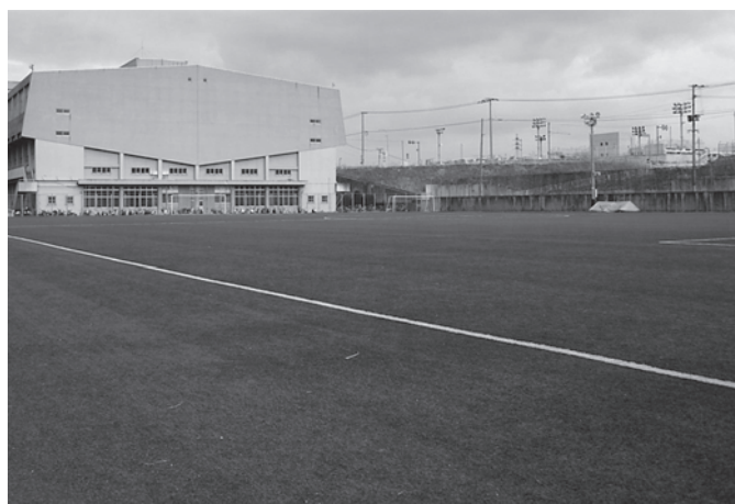
企業と連携して最新の人工芝を使って作られたサッカーグラウンド