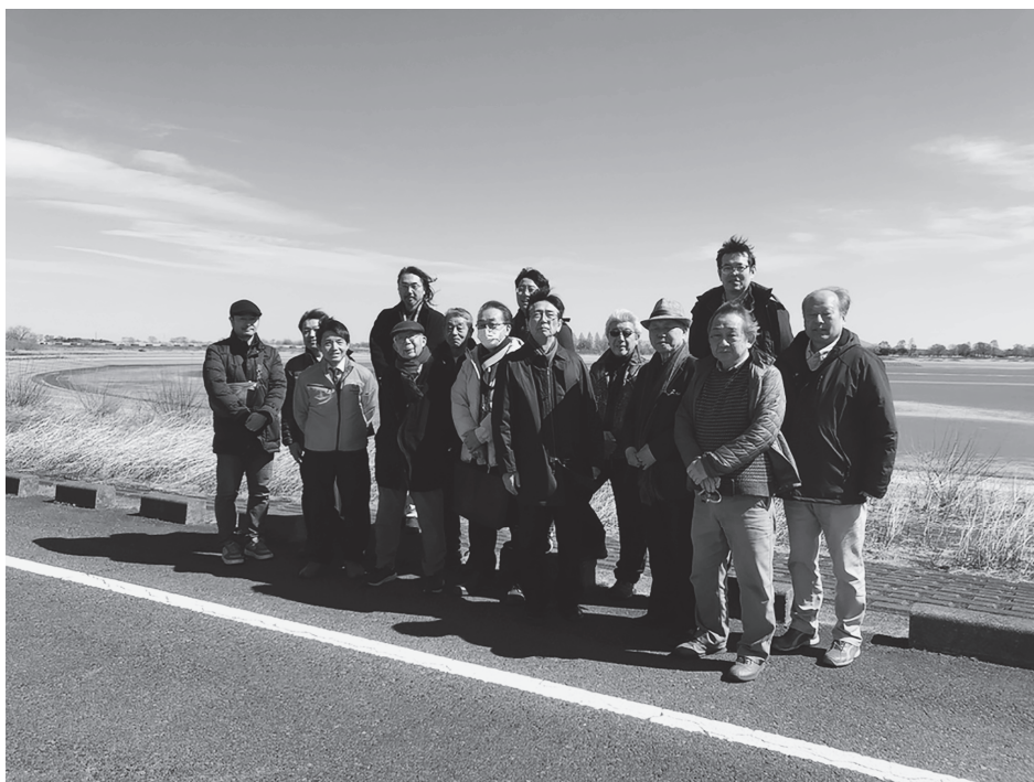
2023 年度春季実態調査（「北関東パート4」）参加者集合写真 （2日目：渡良瀬遊水池にて撮影）