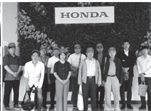
ホンダ・ベトナム第2工場にて