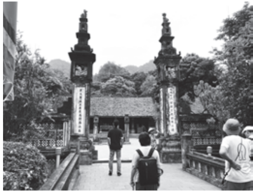
歴史遺産ニンビン視察