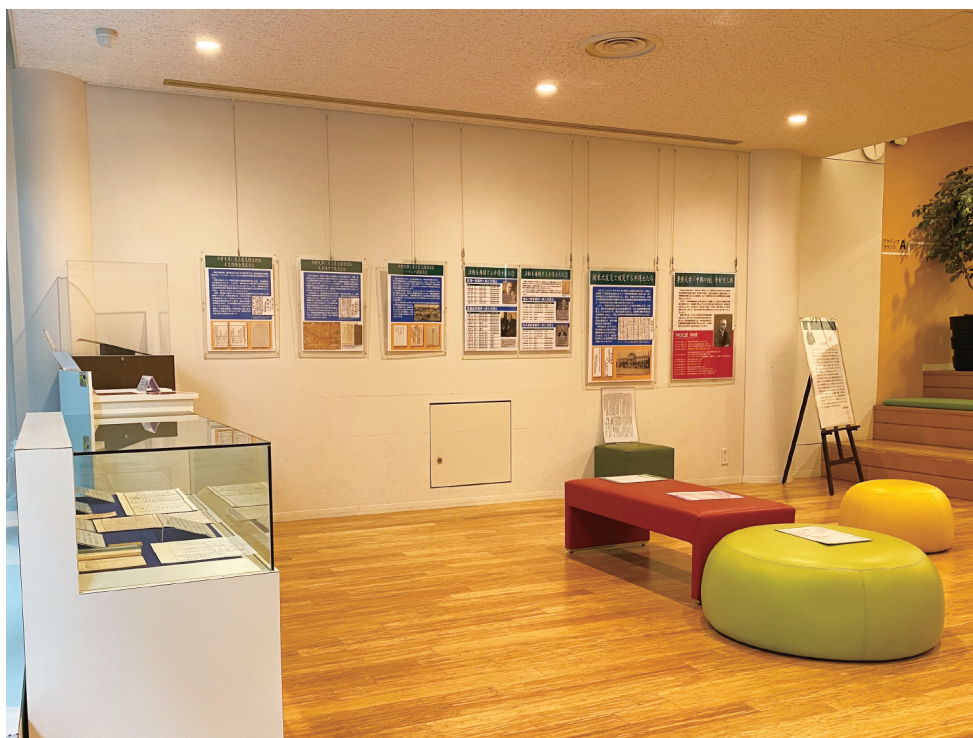
第1部「今村力三郎文庫の世界 パートⅢ 関東大震災と専修大学」のコーナー