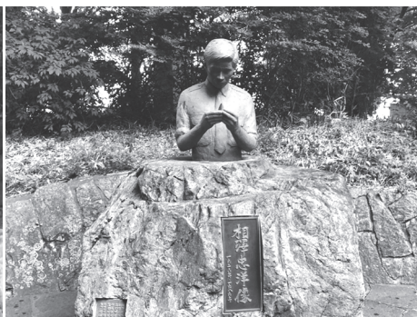
岩宿遺跡碑および相澤忠洋像