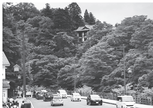
現行の金谷ホテル遠景