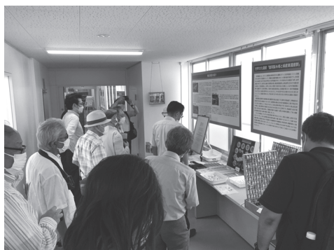
田島弥平旧宅案内所にて