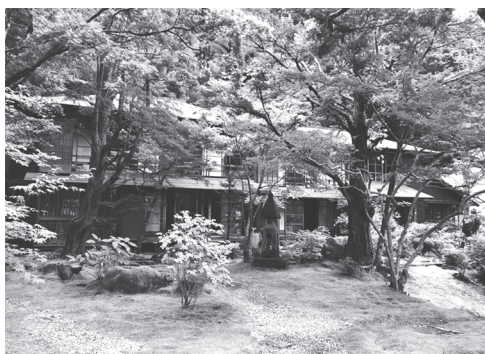
金谷ホテル歴史館（発足時のもの）