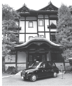
歴史館から現行ホテルまでは徒歩組およびタクシー組に分かれて移動