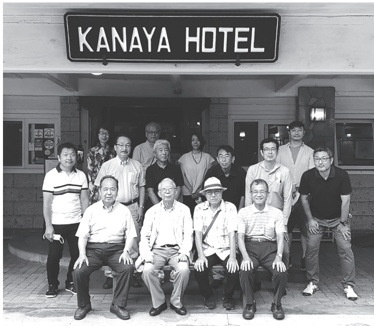
2022年度夏季実態調査参加者集合写真（最終日）