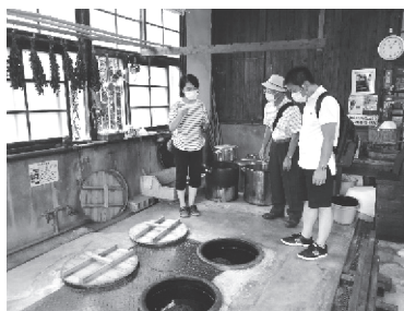
藍染の説明を受ける調査員