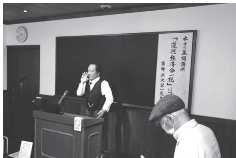
渋沢栄一記念館内にて