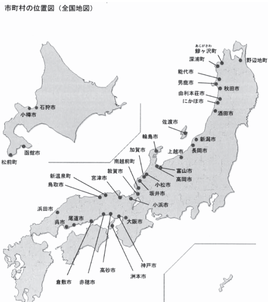
図2：北前船寄港地の認定地域 11