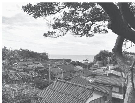
宿根木の街並み