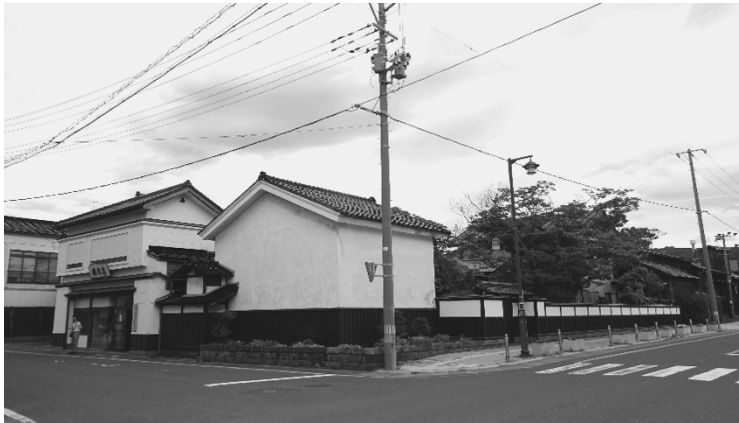
写真9：町の一角に広がる飛良泉本舗

写真9でわかるように、町の角地に広い敷地を持つ飛良泉酒造であったが、この中にある蔵は、遠戚に当たるTDK創業者の齋藤憲三氏宅にあった蔵を移設されたものとのことであった。