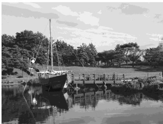
写真 14：北前船国内最大 1/2 スケールの模型船

日和山公園の案内板には、公園が酒田市のシンボリック的存在であり、かつて酒田湊に出入りした船頭衆がここから日和をみて出航を判断したと記してあった。酒田港や最上川が一望できる展望広場には方角石が残っており、もう一つの小高い丘には白い瀟洒な六角灯台もある。さらに北前船にちなんだものとして、昨日の台風のせいか逆風にも一帆で進んでいくという帆は残念ながら下ろされていたものの、公園の大きな池には北前船の 2 分の 1 という模型船（日和丸）が浮かんでいた（写真 14）。