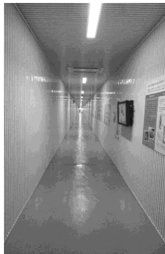
写真13：長い廊下＝見学行程＝工場ラインの長さ