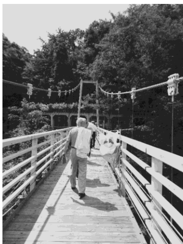
写真 16：醸造所とワイン貯蔵庫をつなぐふれあい橋 （突き当たりが貯蔵庫）

ひとしきり話をうかがった後、ワイン醸造の工場見学となった。大きな醸造タンクが何台も並ぶ工場内では、タンクの上に乗って作業をする様子が見えた。さらに工場を出て、山ぶどう研究所の脇を流れる梵字川に架かる大きな橋を渡ると（写真 16）、旧国道 120 号線のトンネルを再利用した自然のワインセラーがあり、そこへ案内していただいた。トンネル内貯蔵庫は真夏でも 18℃を越えない天然のワインクーラーである。残暑とはいえ、やはり入ると少しひんやりと感じた（写真 17）。瓶で、樽で、タンクで、とさまざまな貯蔵の形でワインが並んでいた。