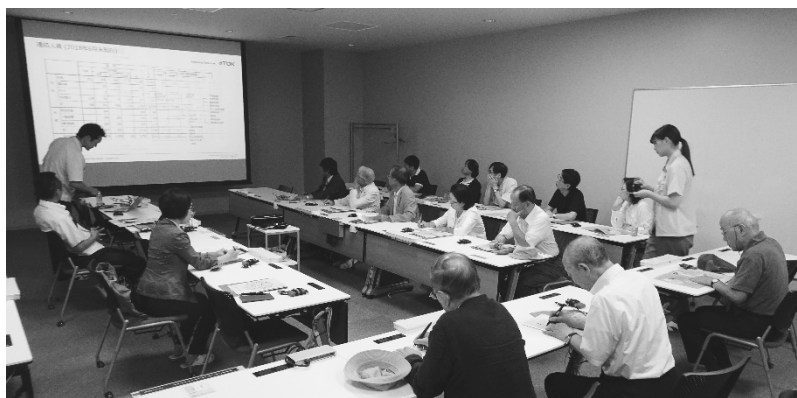
写真5：TDKでの質疑応答

次に、本荘工場西サイトへバスで移動、まずは積層セラミックコンデンサについての説明を受けた。誘導体と内部電極を幾重にも重ねる技術が製造の基本であるが、現在の製品トレンドは高大容量化（高誘導率、薄層、多層化）と小型化である。現在そのコンデンサは10個であきたこまちの米粒1つ分のものや、海岸の砂一粒ほどの大きさなのだという。目に見えるのだろうかと思いつつ工場見学に出ると、その実物展示には拡大レンズが付いていた。見学では、製品の製造棟が材料の調合から検査包装まで（製造工程は14工程）長さ352mの直線ラインとなっており、これをまっすぐに歩いていった。廊下からガラス越しに見学できる工場内はとてもクリーンである。工場内の広さの割に人は少なかったが、それでも調整や点検などであろう、てきぱき立ち働く従業員の様子が見えた。受注生産による製造は、車載用に特化（70%～80%）しているとのことだったが、車の電装化が進む時代にそれはさらに進んでいくのであろう。会議室に戻った後も短い時間ではあったが、中国工場や業態転換、ライバル会社についての質疑応答が交わされた（写真5）。