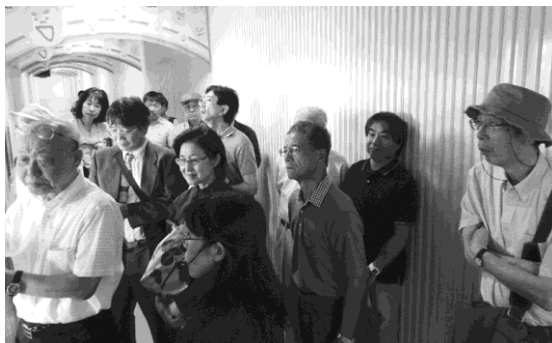
写真12：製造工程に見入る参加者

観光部の方が工場案内に付いてくれたが、実は工場のせんべい焼き工程は朝7時に始まるので、私たちが訪れた14時頃にはほとんど最後の工程だけになっていた。働いている人たちの姿が見えなかったのは残念であったが、おせんべいの種類ごとに製造機械があり、昭和から現役で活躍する焼き釜、炒り機、気球の上部をひっくり返したような味付け機までさまざまな機械が次々と現れた。メンテナンスもさぞ大変であろうと思う。一行から多様な質問が飛び出し、案内役の女性を驚かせたが、ベテランの彼女はどの質問にも応じてくれたので、一行はただでさえ時間のかかる長い廊下をゆるゆると進んでいった。ちょうど焼成工程にくると、お待ちかね?の試食せんべいが用意されていた。焼きたてとのことで、初めて食すオランダせんべいのおいしさに驚いた。これが酒田市民のソウル・フードである。