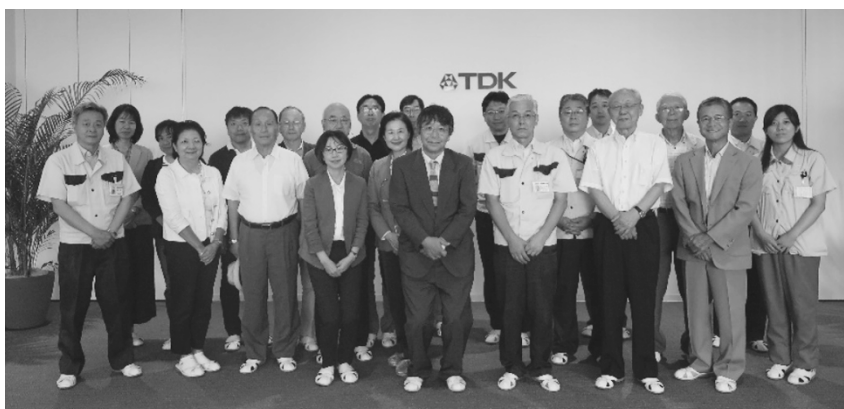
写真6：TDK 本荘工場（東サイト）での記念撮影