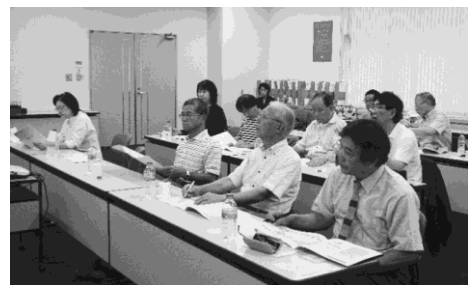
写真 21、写真 22：工場見学のあとの質疑応答の様子