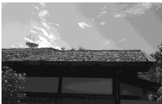
写真 10：青空に映える石置杉皮葺屋根

旧鑑屋は酒田を代表する廻船問屋で、本姓は池田であったが、最上義光に鑑屋の屋号を与えられてから鑑屋惣左衛門と名乗るようになったという。酒田三十六人衆としても活躍した名家である。現在旧鑑屋は酒田市の施設であるが、平成元年まで人が住んでいたとのことで、現在21代目の当主は会社員だそうだ。建物は石置杉皮葺屋根（写真10）の典型的な酒田の町屋造りで、通り庭に面して十間程の座敷部屋が並ぶ。入り口の左手には美しい庭園があり、通り庭を突き抜けた先の裏戸口を出ると左手に土蔵もある。井原西鶴の『日本永代蔵』に鑑屋の話があり、家主惣左衛門の才覚にて家が栄えたという繁栄ぶりを記した箇所があるとのことで、その様子が記述された部分が、各座敷のふすまに小分けに貼り出されていた。そこで鑑屋は「北の国一番の米商人」と紹介されている。他にもおもしろい記述があった。「亭主（鑑屋の）、年中袴を着て、少しも腰を延さず、内儀は、軽い衣装をして、居間を離れず、朝から晩まで笑い顔して、なかなか上方の間屋とは格別、人の機嫌を取り、見過を大事に掛けける」