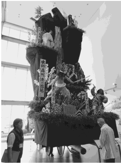
写真 3：土崎港曳山祭りの山車