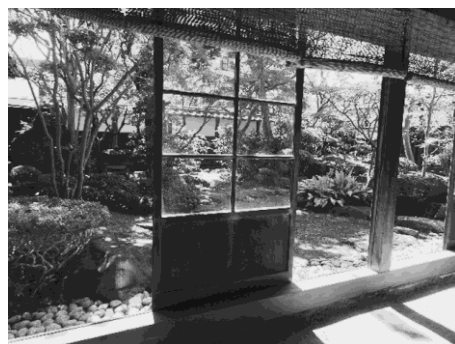
写真 11：三之間から見える南庭園

ちなみに、鑑屋がメンバーであった酒田三十六人衆とは奥州藤原氏滅亡の際、藤原秀衡の妹である徳の前を守って酒田に逃れてきた藤原氏家来衆のことである。彼らが後に住を構えて廻船問屋として港を管理し、財とともに酒田独自の（藩政にも組み入れられるほどの）自治組織を生み出して酒田湊繁栄の礎を築いたのである。常に36人で組織されていたわけではないようで、長い歴史の中でメンバーも入れ替わってきたという。