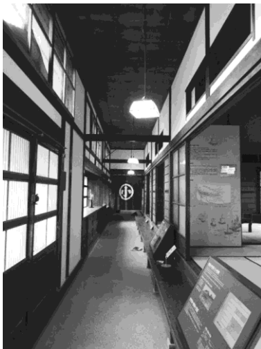
写真 19 : 旧小澤家通り土間

小澤家は、江戸時代後期には米穀商を営んでいた家で、明治時代の初めに回船経営に乗り出している。その後も運送・倉庫業、回米問屋、地主経営、石油商とさまざまな事業に進出した新潟を代表する商家であり、また歴代当主は新潟の政財界でも活躍している（小澤家住宅リーフレットから）。小澤家住宅は、その小澤家の店舗兼住宅であり、新潟の典型的な町屋として新潟市から文化財指定を受けている建造物である。