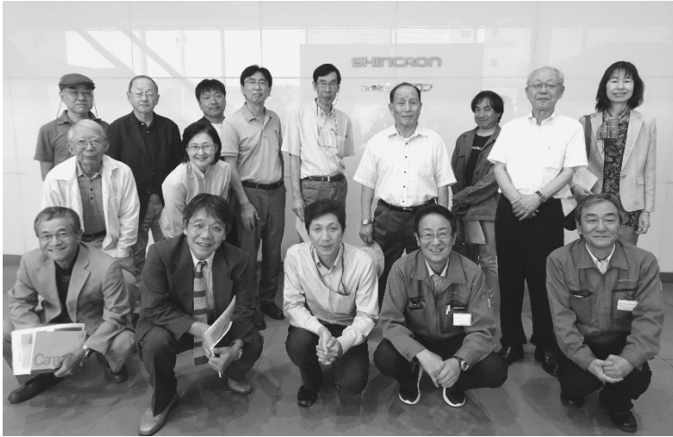
写真 18 : (株) シンクロンでの記念撮影