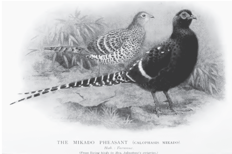
図2 ミカドキジの番