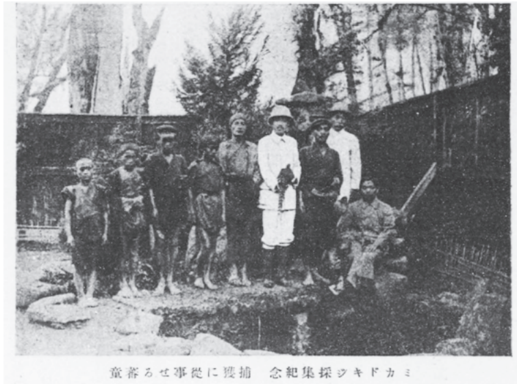
図3 ミカドキジ採集の記念写真