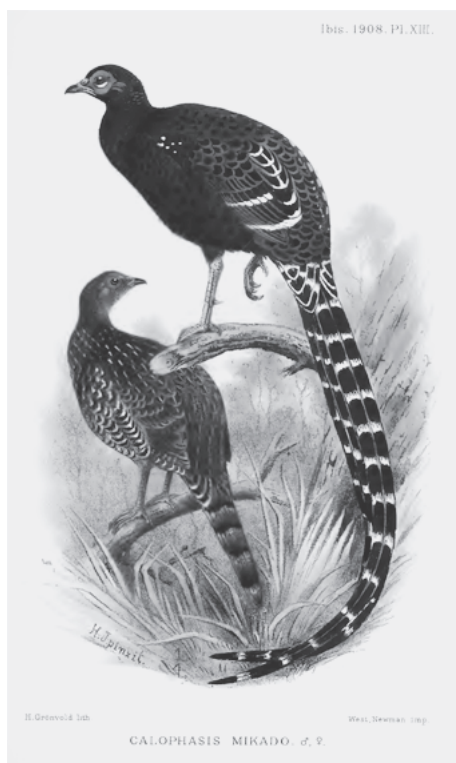
図1 ミカドキジの番

オグルヴィ＝グラントは「台湾の鳥類に関する補注」において、ミカドキジの脚の鱗の形状について考察を加えた。ミカドキジの該当部位は、八角形上の小さな鱗が網目状に隆起しており、キジ属のものとも、他のヤマドリ属のものとも異なるという。ミカドキジをキジ属に分類しようとするロスチャイルドに対し、オグルヴィ＝グラントはミカドキジの独自性を強調したのである。なお、この特徴に気がついたのはアマチュア鳥類画家のヘンリ・ジョーンズで、ロスチャイルド所有の標本をもとにミカドキジの肖像画を描いているときだったという。『アイビス』には、このジョーンズのスケッチに基づくミカドキジの雌雄一対