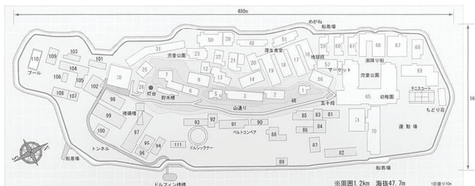
図 3. 端島(軍艦島)施設平面配置図

注：図中の番号 1～70 は住居・生活関連施設(2, 3, 5, 6, 1256 は職員社宅、16～20, 30, 31, 48, 56, 57, 59, 60, 61, 65, 67 は鉱員社宅)、82～110 は炭坑施設。ただし、100 はプール、103 は下請住宅