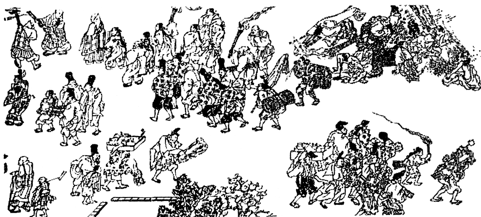
古代社会—平安時代の京都民衆の生活 京都朝廷の大極殿（後には清凉殿）で、毎年正月8日から14日まで、御齋會（ごさいえ）といつて、僧侶が、金光明最勝王經を講説して、國家の安寧をいのる儀式がある。天武天皇9年（681年）ごろからはじまり、奈良・平安時代には、もつとも盛んで、鎌倉時代からだんだん衰えていった。これはそのもつとも盛んな平安時代の御齋會の式場の外部のさまで、集つた京都の民衆が、夜のこととて、たいまつをかざしたり、焚火したりしながら、頭に物をいれたもろぶたを戴いたり、炭俵のような物を背負ったり、片肌ぬぎて火にあたったりするなど、いろいろな行動をとつている。（西岡虎之助『日本文学における生活史の研究』より転載）

る単純商品生産として運ばれていたものである。重要なことなので例をあげて説明してみよう。たとえば都市の成立についてある論者は経済的観点から規定して「商工業の所在にして外部より不斷の食料品移入を必要とする一地区」（小野晃嗣「近世都市の発達」〔岩波講座『日本歴史』所収、1934年〕）といっておられる 1) が、その点では「食料品」と共に必ず「薪炭材」をも付け加える必要があるだろう。