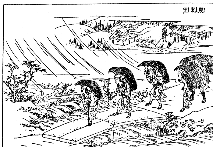
京都の北郊鞍馬山附近は、古くから製炭業が発達していた。山村の婦女子は之を背に負って市中へ搬出した。(拾遺都名所図會)

(イ) まず、林業は、同じ原始産業である鉱業等と異なって再生産、すなわち育林が可能である。薪炭材資源の育成であれば10年から20年かかるが、用材の場合は人工造林であれば早くて30年前後、天然更新の場合は100年またはそれ以上のまさに気が遠くなるような長年月の育成期間が要求される。その点、同じ原始産業の農業（米作等）のように植付けから収穫までに一箇年でいちおう完了するという産業とは大いに異なっている。もっとも西欧では用材林のもっとも早い針葉樹（唐松）の伐採でも60～80年である（カール・ハーゼル『森が語るドイツの歴史』160頁，築地書館）。カール・マルクス『資本論』（6冊目143頁，岩波文庫）では育林は100年はかかると見ていた。日本の場合は、雨量が多く高温多湿のため、林業がヨーロッパに先駆けて確立した最大の自然的要因がここにある。しかしもちろん、自然条件だけが日本において林業地を早期に実現させたわけでは決してないことに注意が必要である。